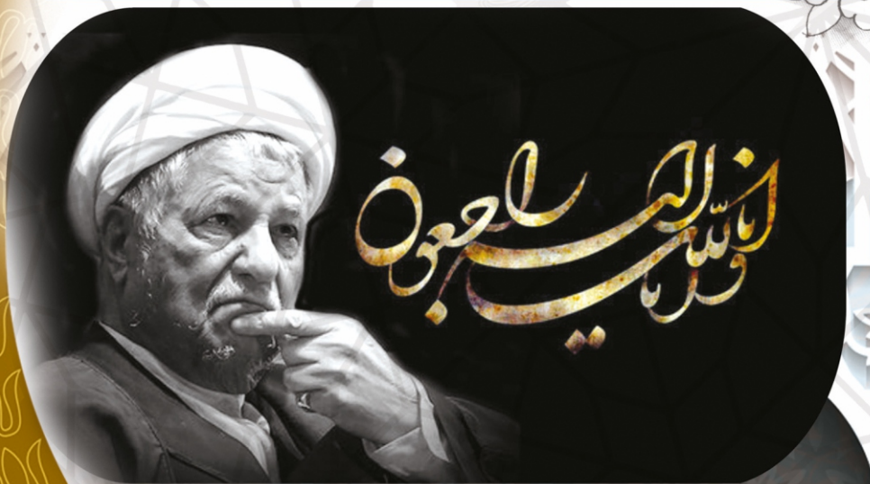
مراسم یادبود و بزرگداشت حضرت آیت الله رفسنجانی (ره) رئیس فقید مجمع تشخیص مصلحت نظام با حضور دانشگاهیان برگزار شد.