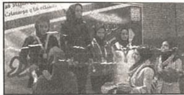
به مناسبت سالروز آزادسازی خرمشهر؛ المپیاد ورزشی دانشجویی در دانشگاه شهید چمران برگزار می‌شود