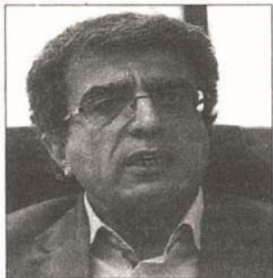
دادن ۱۵ درصد بودجه خود به امر پژوهش را در همین مسیر توصیف کرد.

و دستگاه‌های بین‌المللی نیز در آنها مشخص شده‌است.