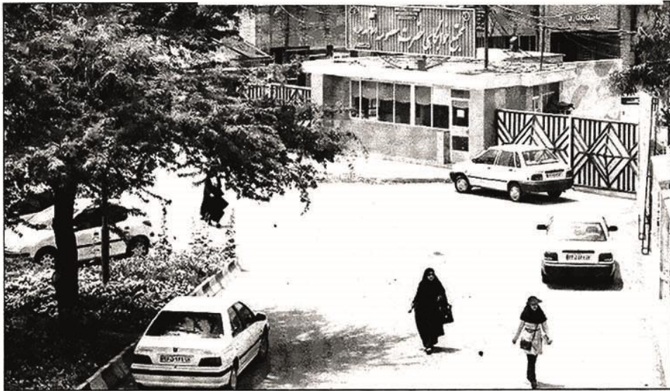
زهرا چوبان کاره