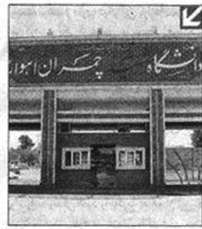
معاون پژوهش و فناوری دانشگاه شهید چمران اهواز با تشریح عمده برنامه‌ها و اقدامات این دانشگاه برای مقابله با پدیده گرد و غبار،

گفت: کنفرانس بین‌المللی ریزگردها تمام مطالعات انجام شده در این خصوص را برای رسیدن به الگوی اجرایی حل مشکل، گردآوری می‌کند.