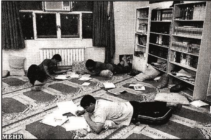
دانشجویی دولتی را از بین صفر تا ۱۰ رتبه‌بندی کردیم و با توجه به امتیازاتی که خوابگاه‌ها کسب کردند آنها را در ۵ کلاس با طبقه‌بندی کردیم. رئیس صندوق رفاه دانشجویان اظهار داشت: با اجرای رتبه‌بندی خوابگاه‌های

یزدان مهر در خاتمه با اشاره به آمادگی خوابگاه‌های دانشجویی برای استقبال از دانشجویان در سال تحصیلی جدید، اظهار داشت: خوابگاه‌های دانشجویی در تابستان امسال به کارگاه‌های تعمیر و تجهیز تبدیل شدند و حداکثر تا مهرماه ۵۰۳ خوابگاه دانشجویی به رتبه‌های بالاتر ارتقا پیدا خواهند کرد. نورخوزستان یکشنبه ۱۹ شهریور