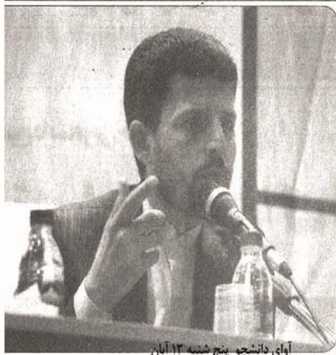
آقای دانشجو پنجشنبه ۱۳ آبان

شورای اسلامی با اشاره به دست کاری کردن ژن های این محصولات و اضافه نمودن یک یا چند ژن خاص در پی تولید این محصولات بیان داشت: یکی از مضرات این نوع محصولات و تأثیرات جبران ناپذیری کاهش زاد و ولد و عقیم سازی و کاهش تنوع زیستی در ایران می باشد. وی همچنین خاطر نشان کرد: در پی تحقیقی که ۴۰۰ دانشمند از کشورهای مختلف انجام دادند به این نتیجه رسیدند که رویکرد اکثر کشورهای جهان سیر نزولی نسبت به این محصولات نشان دادند.