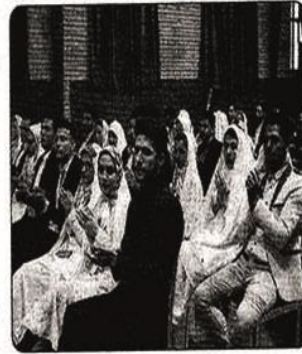
مهر-نهاد نمایندگی مقام معظم رهبری مراحل ثبت نام بیست و یکمین دوره ازدواج دانشجویی اعلام

کرد. زوج‌های دانشجویی واجد شرایط می‌توانند به سایت رسمی ستاد ازدواج به آدرس http://ezdevaj.nahad.ir مراجعه کرده و اطلاعات مربوط به خود را ثبت کنند. سپس پرینت نسخه چاپی را دریافت کرده و به همراه مدارک اعلام شده جهت تأیید نهایی در سایت به دانشگاه ارائه دهند. سپس بعد از اعلام کاروان‌ها، کاروان دلخواه را انتخاب کنند. درباره اینکه اگر زوجی قبلاً ثبت نام کرده باشند آیا می‌توانند دوباره ثبت نام کنند، نیز توضیح داده شده است. حالت اول: اگر قبلاً ثبت نام صورت گرفته ولی اعزامی صورت نرفته، اگر هفته آخر ثبت نام سایت باز شد، می‌توانند به عنوان جامانده انتخاب کاروان کنند.