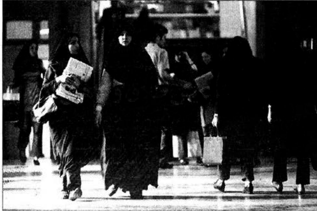
مدرک‌های خود اقدام کنند. علوم افزود: پس از بررسی درخواست‌ها توسط دانشگاه‌های مبدأ، دانشگاه‌های خود اقدام کنند.

وی همچنین درباره ظرفیت دانشگاه‌های مختلف در نقل و انتقالات گفت: ما آماری که از سازمان موسسه آمار و پژوهش وزارت علوم دریافت کرده‌ایم را ملاک قرار داده‌ایم که بر این اساس ظرفیت نقل و انتقالات برای دولتی‌ها ۲۰ درصد و برای غیرانتفاعی‌ها ۱۵ درصد از ورودی‌های سال ۹۳ خواهد بود.