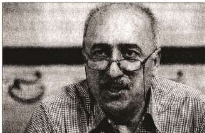
اقتصادی فعلی وجود ندارد.

دانشیار دانشکده اقتصاد دانشگاه شهید چمران اهواز توسعه را واقعیتی فیزیکی و ذهنی خواند که در آن جامعه از طریق مجموعه ای از فرآیندهای اجتماعی، اقتصادی، و نهادی به ابزاری برای تأمین یک زندگی بهتر دست می یابد و افزود: هدف اساسی همه ی جوامع از توسعه دستیابی به حداقل سه هدف عمده افزایش دسترسی به کالاها و خدمات اساسی لازم برای بقا، افزایش سطح زندگی و افزایش هر چه بیشتر دامنه انتخاب های اقتصادی و اجتماعی برای همه افراد جامعه است. وی یادآور شد: نگاهی به تجربه چند کشور اخیراً توسعه یافته مانند مالزی، هند و چین نشان می دهد که یک دوره زمانی ۲۰ ساله کافی است تا کشوری در جاده توسعه قرار گیرد.