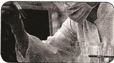
مهر- مهدی کشمیری، مدیرکل دفتر برنامه‌ریزی امور فناوری وزارت علوم با اعلام این خبر گفت: در

منعقد تا سقف ۲۰۰۰ میلیون ریال حمایت خواهد شد. این حمایت محدود بوده و بر اساس پیشرفت قراردادهای منعقد به آنها اختصاص خواهد یافت. وی افزود: دانشگاه‌ها، مراکز پژوهشی، پارک‌های علم و فناوری و مراکز رشد کشور که دارای طرح‌ها و محصولات فناورانه با قابلیت بالای فروش و یا جذب سرمایه‌گذار بوده و متقاضی استفاده از این حمایت هستند، می‌توانند خلاصه مشخصات طرح یا محصول، مشتریان و سرمایه‌گذاران را به دبیرخانه گروه