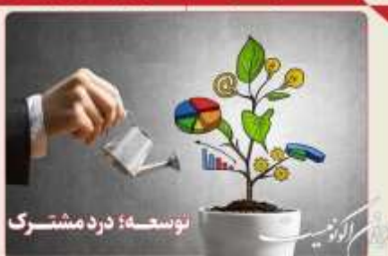
توسعه؛ درد مشترک

کد خبر: ۵۲۳۳۰۶ - تاریخ انتشار: ۲۰ مهر ۱۴۰۱ - ۱۸:۰۲