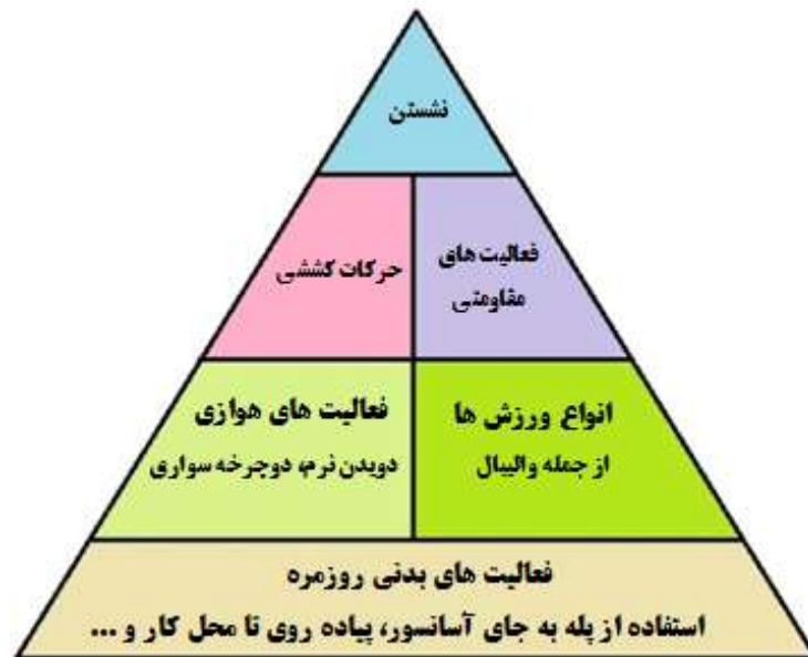
شکل ۱. هرم فعالیت بدنی

چند خیابان جلوتر و پیمودن قسمتی از مسیر به صورت پیاده، انجام کارهای باغچه و منزل را نام برد. در سطح دوم هرم، فعالیت‌های هوازی مانند پیاده‌روی سریع، دویدن، دوچرخه‌سواری، شنا، حرکات موزون هوازی و انواع ورزش‌ها قرار می‌گیرند. در سطح سوم هرم، حرکات کششی و فعالیت‌های مقاومتی قرار دارند. در قله هرم، فعالیت‌هایی قرار دارند که اگرچه فعالیت بدنی محسوب می‌شوند اما جزء فعالیت‌های کم تحرک محسوب می‌شوند به همین دلیل باید آنها را به کمترین میزان ممکن رساند. از جمله این فعالیت‌ها می‌توان تماشای تلویزیون، استفاده از موبایل و یا بازی‌های کامپیوتری را نام برد. این فعالیت‌ها علاوه بر افزایش خطر ابتلا به بیماری‌های مختلف جسمانی و روانی، موجب کاهش انعطاف‌پذیری مفاصل و قدرت و استقامت عضلانی و در نتیجه خطر آسیب دیدگی و دردهای اسکلتی عضلانی می‌شوند.